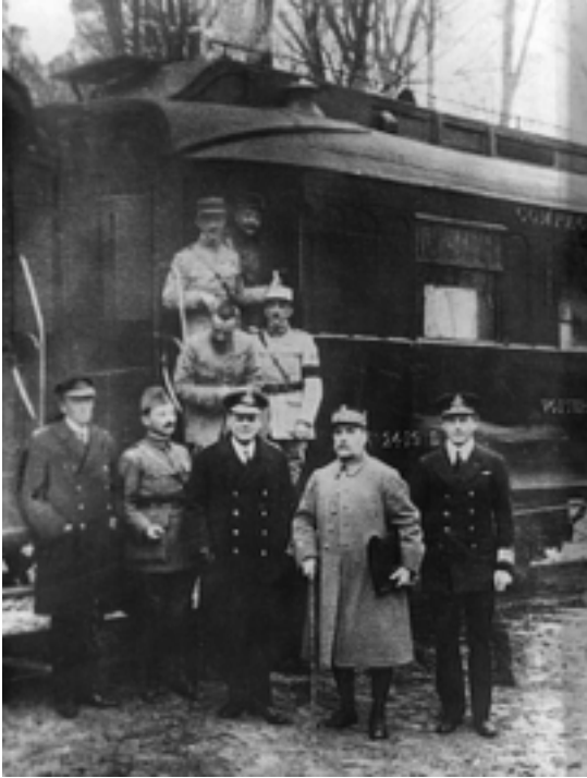
Armistice du 11 novembre 1918

La Capitulation et le traité de Versailles L'entrée des Etats-Unis dans la guerre, en avril 1917, a définitivement renversé le rapport de forces et mené l'Allemagne à la défaite militaire. Il s'en est suivi l'armistice, le 11 novembre 1918 et puis le traité de Versailles en juin 1919. Ce fut un traité désastreux où les alliés, et en particulier les Français, ont voulu se venger en mettant l'Allemagne à genoux et en lui faisant payer une dette de guerre tellement exorbitante que le pays se trouvait dans une situation économique dramatique dont il ne pouvait se relever. Le sentiment d'humiliation et de frustration en Allemagne ouvrit la voie à Hitler et aiguïsa un sentiment de revanche qui se traduisit 25 ans plus tard par la Deuxième Guerre Mondiale, suite « logique » de la première.