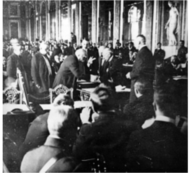
Traité de Versailles, juin 1919